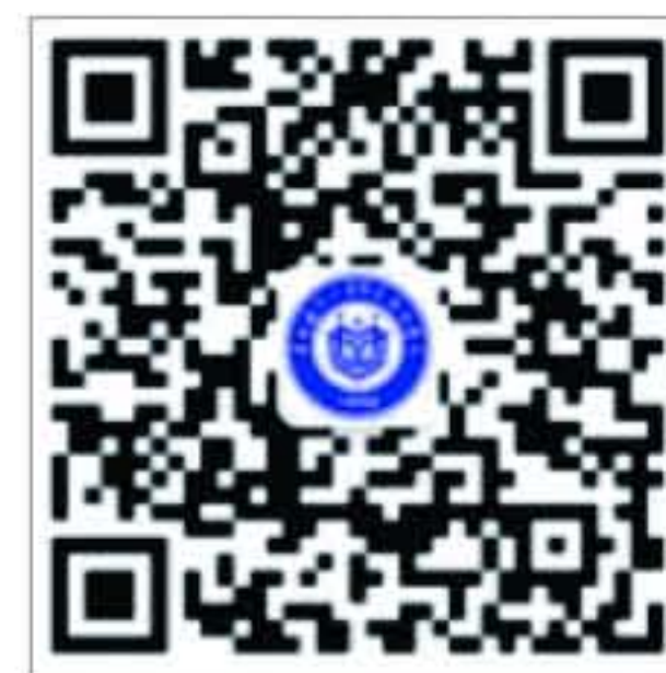
学院财务处微信公众号