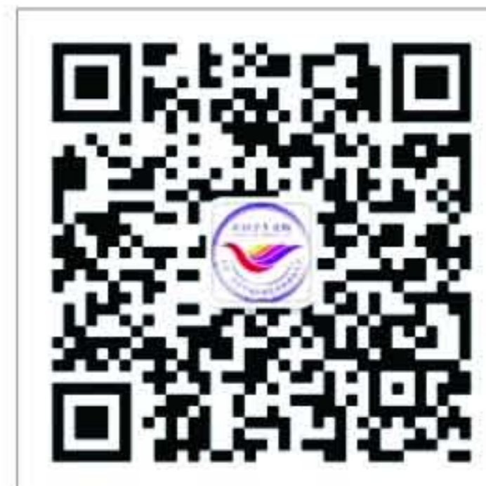
“中国学生资助” 微信公众号