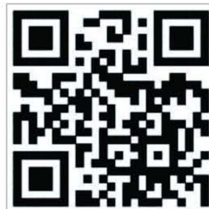
全国学生资助 管理中心网站