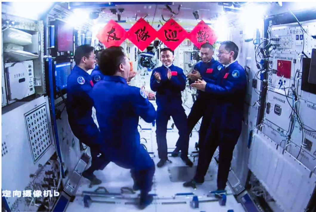
在北京航天飞行控制中心拍摄的神舟十六号航天员乘组与神舟十七号航天员乘组交流的画面（2023年10月26日摄）。

（六）“大国工匠是我们中华民族大厦的基石、栋梁。”习近平总书记饱含深情的一番话，充满着对劳动者的敬意，更揭示了人才对于国家发展的重要意义。人是生产力中最活跃的因素，也是最具有决定性的力量。基于对人民群众历史主体地位的深刻认识，马克思主义经典作家鲜明提出了“主要生产力，即人本身”的观点。推动高质量发展，人才资源是第一资源，创新驱动本质是人才驱动。发展新质生产力，归根到底要靠人才，人才越多越好，本事越大越好。